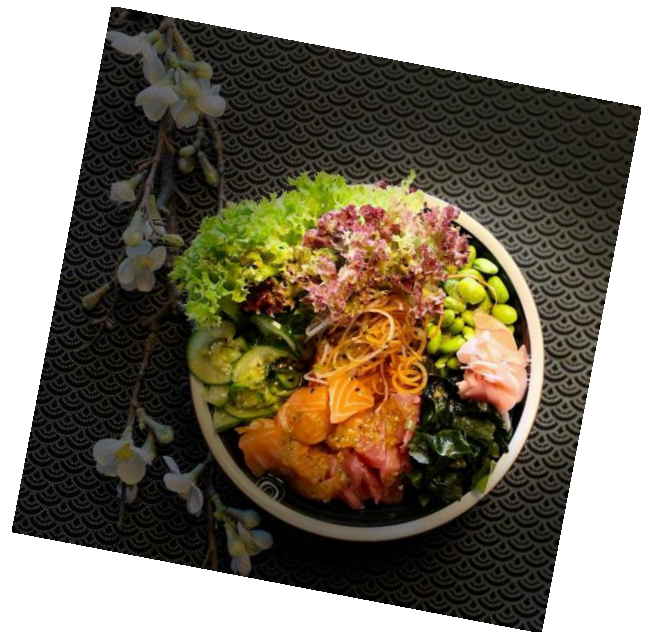
YEN'S POKÉ mit Tuna/Lachs